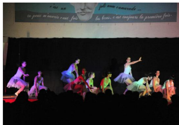
Gala de danse du Club Omnisport et ses magnifiques costumes