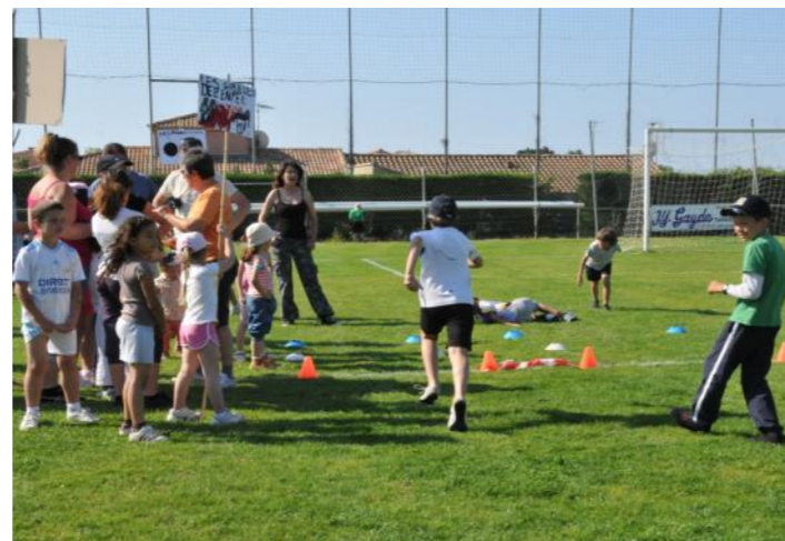
Olympiades des Ecoles avec plus de 250 enfants