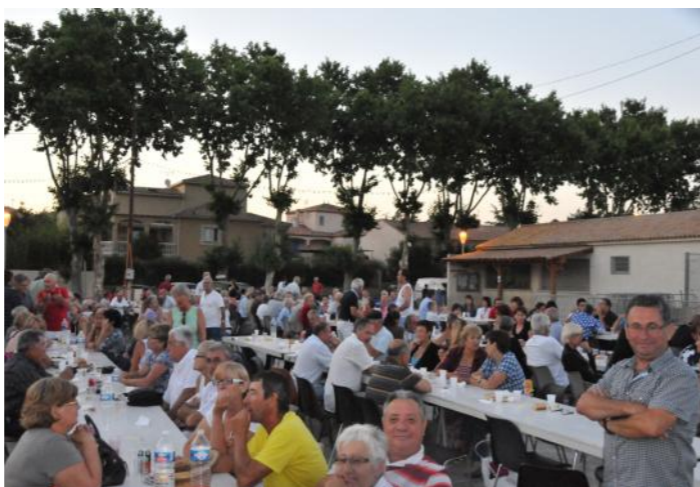
Affluence des grands jours à la soirée « grillade »