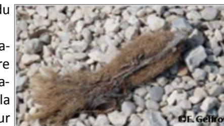
Pelote de posidonie

N'oubliez pas, le nettoyage de la plage est avant tout l'affaire de chacun : repartez avec vos déchets.