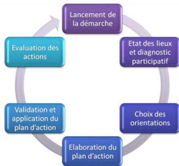
La démarche Agenda 21

La réalisation du plan d'action nécessite plusieurs étapes dont un diagnostic approfondi du territoire. Ce diagnostic se partage entre un état des lieux objectif et un diagnostic participatif. L'état des lieux est basé sur les études disponibles sur le territoire (Documents d'urbanisme, recensements INSEE, base de données nationales...). Il permet de dégager des thématiques de réflexion transversale propre au territoire étudié et en lien avec les préoccupations du développement durable.