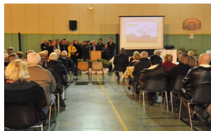
La salle polyvalente comptait 500 personnes à la cérémonie des vœux, où le Maire, après le bilan 2010, annonçait qu'il restait à la tête du Conseil Municipal sous les applaudissements.