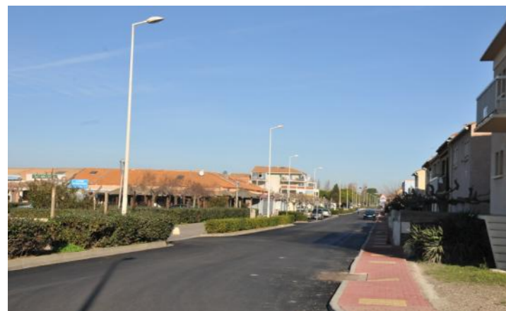
La remise en état des rues du village et de la station