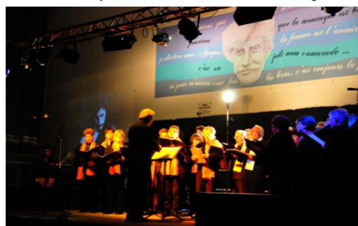
Le 18 février 2011, le Maire, l'Equipe municipale, la Palette, la Marsilia et les enfants des écoles ainsi que de très nombreux Portiragnais rendaient hommage à Jean Ferrat disparu il y a tout juste un an.